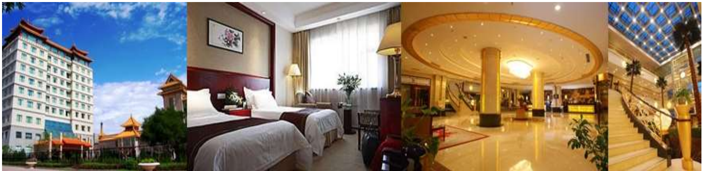
JIU QUAN HOTEL