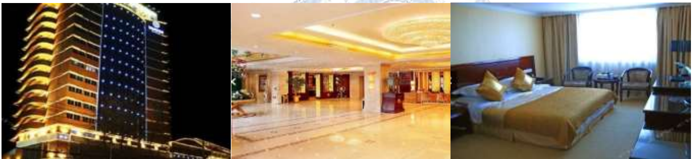
CHANGXIN INTERNATIONAL HOTEL