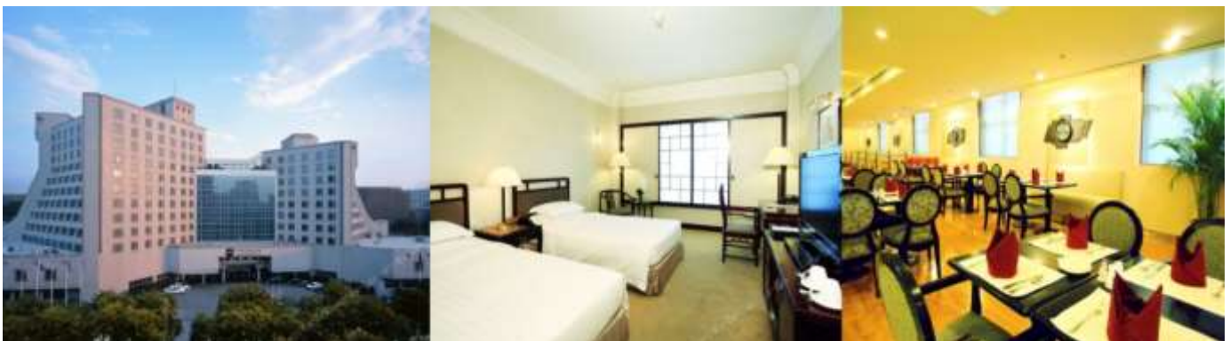
GRAND METROPARK HOTEL XIAN