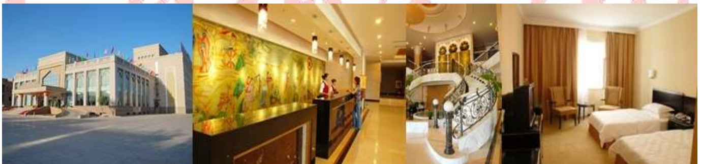
HUO ZHOU HOTEL