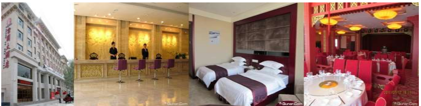
DUN HUANG FU GUO HOTEL