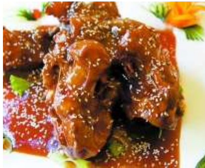
อู๋มมืออู๋ตุ๋น