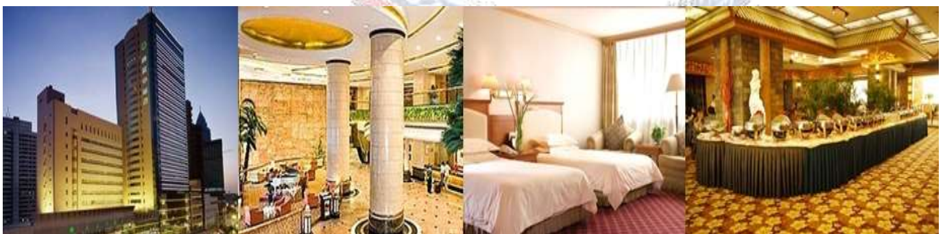
URUMQI MIRAGE HOTEL