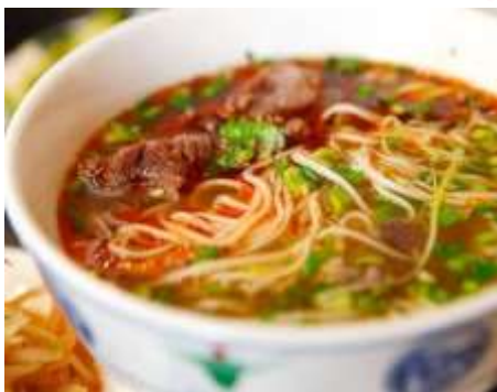
บะหมี่หลานโจว