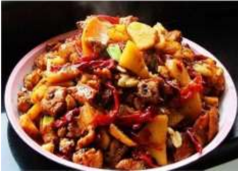
ไก่ผัดมันฝรั่งพริกจินเจียง