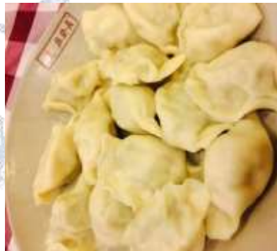
เกี้ยวจางเต๋อฝ่า