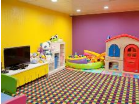
Child Care Centre