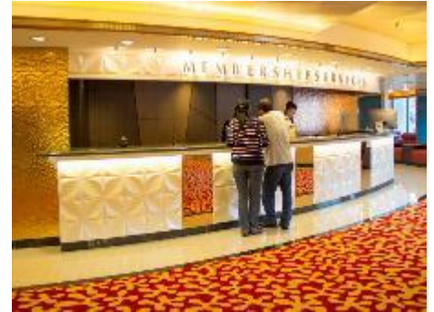
Membership Services Counter