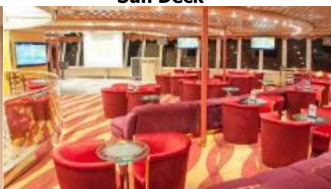
Karaoke Lounge / KTV