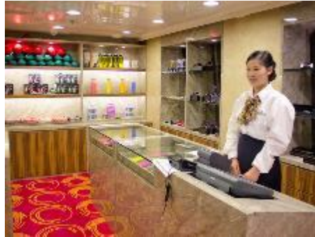
Port's O Call